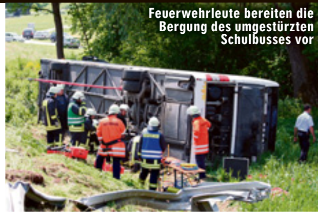
Feuerwehrlente bereiten die Bergung des umgestürzten Schulbusses vor

Biberach/Riss – Ein Schulbus-Fahrer (21) kam mittags bei Biberach von der Straße ab. Das Fahrzeug mit elf Grund- und Hauptschülern (9 bis 15) krachte durch eine Leitplanke, kippte auf